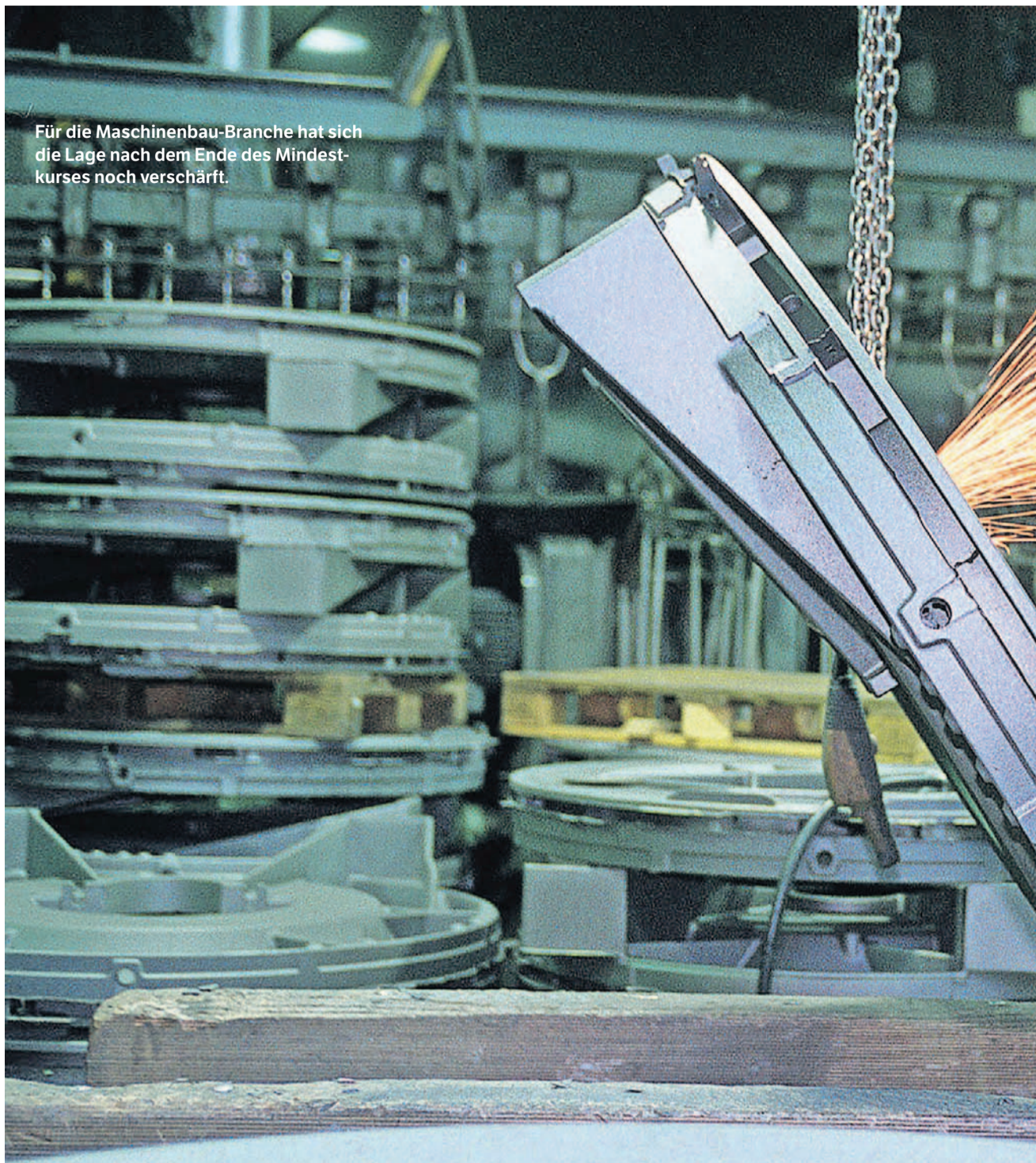
Für die Maschinenbau-Branche hat sich die Lage nach dem Ende des Mindestkurses noch verschärft.

Erwartungen Die Industrie im Aargau sieht ihre Zukunft nach dem Euro-Schock düster. Im Dienstleistungssektor dagegen gibt man sich vorsichtig optimistisch.