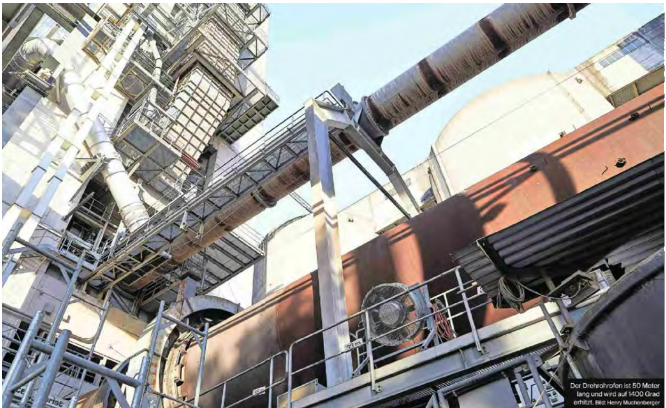
Der Drehrohrföfen ist 50 Meter lang und wird auf 1400 Grad erhitzt.