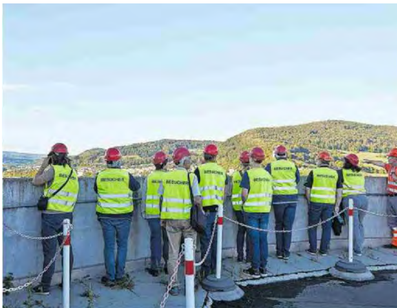
Die Teilnehmerinnen und Teilnehmer an der Nacht der Aargauer Wirtschaft auf dem Dach des Silos.

Referenz: 85521912 Ausschnitt Seite: 4/5