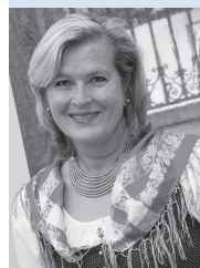
Gastreferentin Dr. Ursula Plassnik