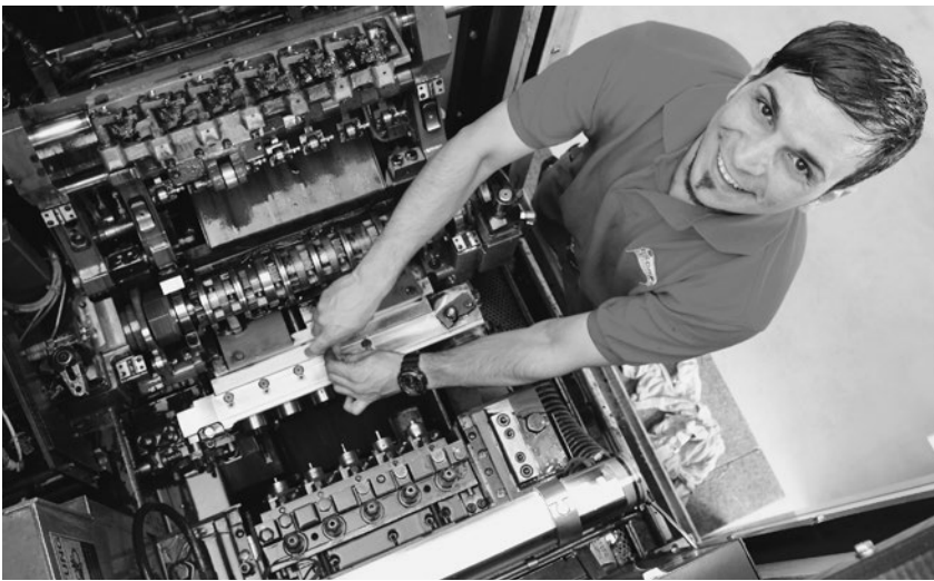
Die Fischer Reinach AG exportiert 90 Prozent ihrer Produkte. Die bilateralen Verträge sind essentiell. Sie garantieren den wirtschaftlichen Erfolg und sichern Arbeitsplätze.