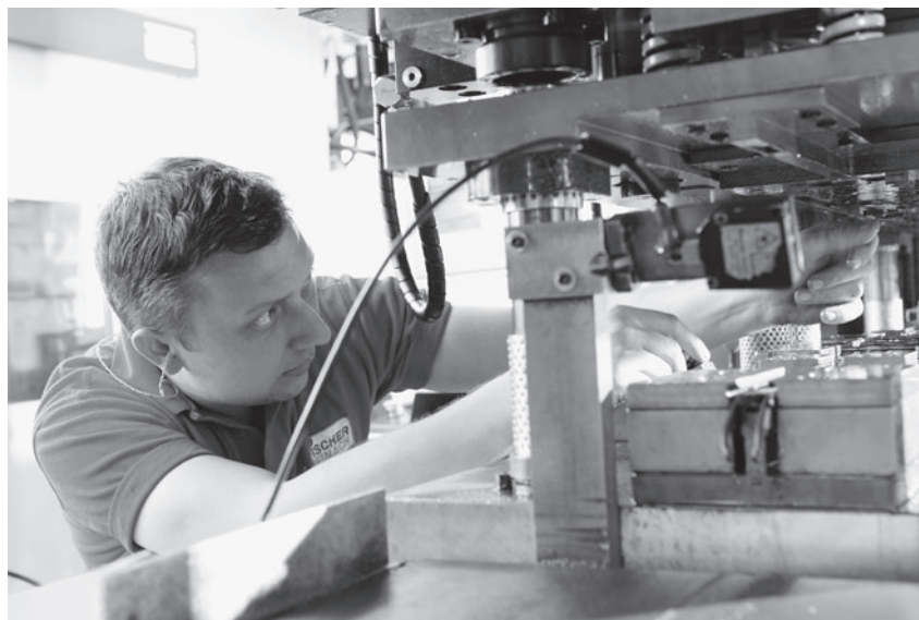
Die Fischer Reinach AG beschäftigt in der Schweiz 200 Mitarbeitende. Sie produzieren für die weltweite Beschläge-, Bau-, Elektro- und Automobilindustrie.

Die bilateralen Verträge garantieren nicht nur den wirtschaftlichen Erfolg. Sie sichern auch zahlreiche