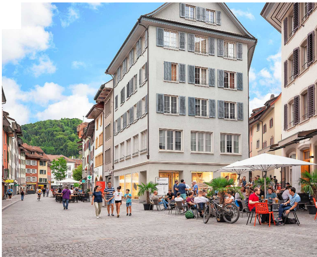
Die historische Kulisse Badens bildet die Basis für ein dynamisches Netzwerk.

ses Projekt wird führende Akteurinnen der Energie- und Elektrotechnik verbinden und sie jährlich zu einem internationalen Treffen zusammenbringen. So entsteht eine starke Community für die Zukunft der Energieindustrie - weit über die Schweiz hinaus.