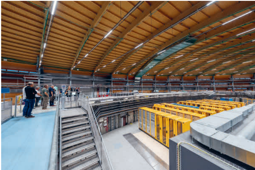
Besucherführung im Paul Scherrer Institut (PSI) an der Nacht der Aargauer Wirtschaft 2025.

Die Nacht der Aargauer Wirtschaft und die Helle Nacht spannen zusammen: Am 4. November 2026 finden die beiden Veranstaltungen erstmals am gleichen Termin statt. Damit erhalten die teilnehmenden Firmen eine grössere Plattform. Melden Sie Ihr Unternehmen jetzt für eine Teilnahme an.