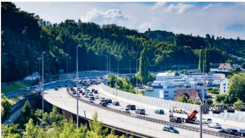
Stau ist auf dem Aargauer Abschnitt der Autobahn A1 ein häufiges Bild. Ein 6-Spur-Ausbau soll hier Abhilfe schaffen.

Die Frage stellt sich also, ob denn eine Verlagerung auf die Bahn ein möglicher Lösungsansatz sein könnte. Im Personenverkehr bildet die Strecke Bern–Zürich gewissermassen das Pendant zur A1. Zwischen den beiden Zentren verkehren zu Stosszeiten bis zu fünf (stark ausge-