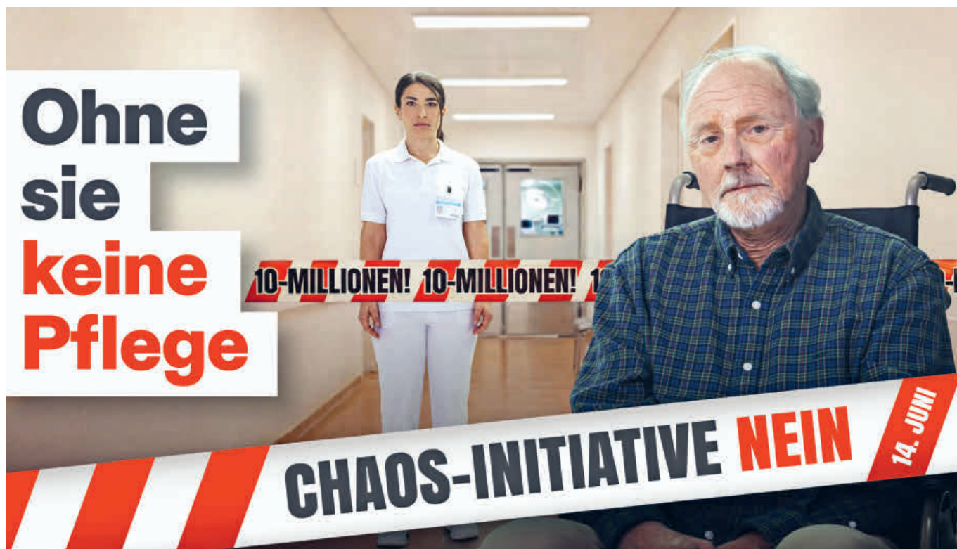
Die visuelle NEIN-Kampagne zur Initiative «Keine 10-Millionen-Schweiz» stellt die massiven Auswirkungen auf den Arbeitsmarkt ins Zentrum.

Die Initiative «Keine 10-Millionen-Schweiz» der SVP möchte mit einer starren Bevölkerungsobergrenze eine Antwort auf die mit der Zuwanderung verbundenen Probleme bieten. Doch mit dem vorgeschlagenen Lösungsansatz wird mehr Schaden angerichtet, als dass Probleme gelöst werden.